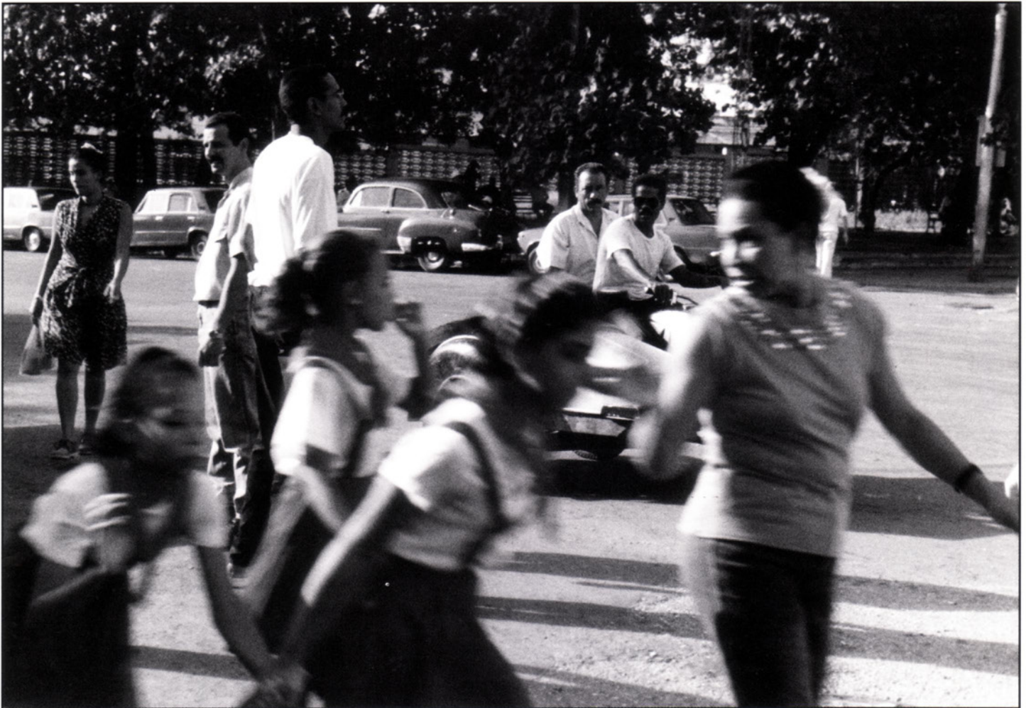
Les enfants.