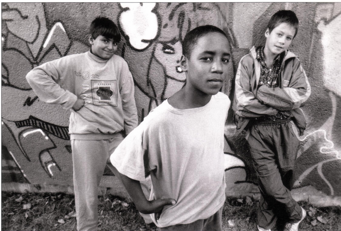
Collège Debussy, Aulnay-Sous-Bois