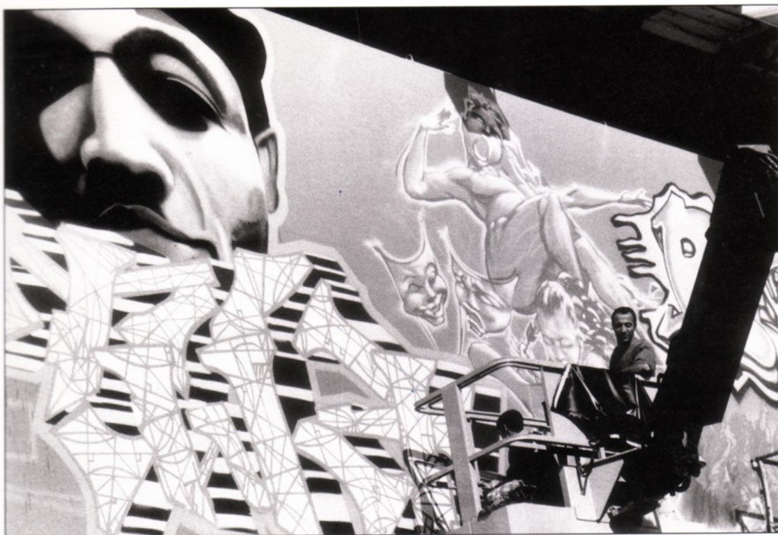
Festival de la culture urbaine 1998.